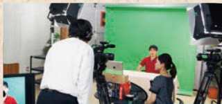
コンテンツの開発・制作支援

シラバスや講義資料などをもとに、資料の効果的な提示方法のご提案、教材のブラッシュアップ、講義の撮影・編集など、eラーニングコンテンツの制作支援を行います。