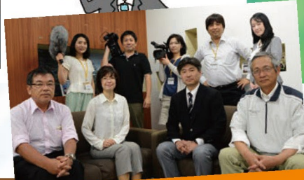
私たちがサポートします！

愛媛大学総合情報メディアセンター教育デザイン室は、ICT (Information and Communication Technology：情報通信技術) を活用した授業構成の見直し、コンテンツ制作のサポート、講義などの撮影、eラーニングの運用サポートなどを行います。