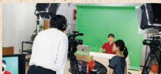
コンテンツの開発・制作支援

シラバスや講義資料などをもとに、資料の効果的な提示方法のご提案、教材のブラッシュアップ、講義の撮影・編集など、eラーニングコンテンツの制作支援を行います。