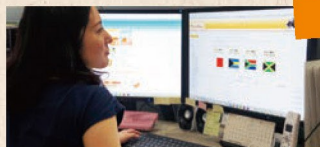
eラーニング運用サポート

シラバスや講義資料などをもとに、資料の効果的な提示方法のご提案、教材のブラッシュアップ、講義の撮影・編集など、eラーニングコンテンツの制作支援を行います。