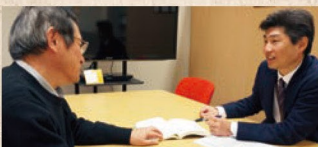
授業科目担当者への ICT を活用した教育支援

インストラクショナル・デザイン (ID / 教育設計) の手法を元に、ICT を活用した授業構成の見直し及び授業をより効果的・効率的・魅力的なものにするための授業設計の支援を行います。