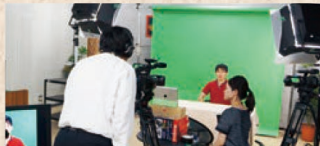
コンテンツの開発・制作支援

シラバスや講義資料などをもとに、資料の効果的な提示方法のご提案、教材のブラッシュアップ、講義の撮影・編集など、eラーニングコンテンツの制作支援を行います。