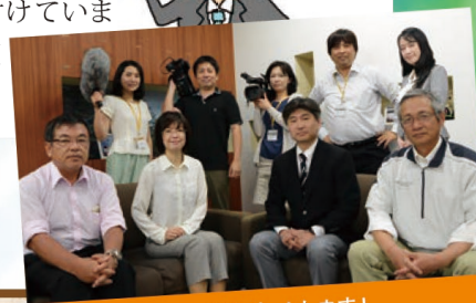
私たちがサポートします!