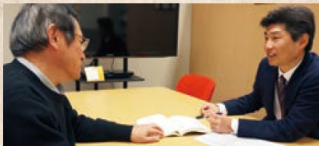
授業科目担当者へのICTを活用した教育支援

インストラクショナル・デザイン(ID/教育設計)の手法を元に、ICTを活用した授業構成の見直し及び授業をより効果的・効率的・魅力的なものにするための授業設計の支援を行います。