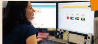
eラーニング運用サポート

シラバスや講義資料などをもとに、資料の効果的な提示方法のご提案、教材のブラッシュアップ、講義の撮影・編集など、eラーニングコンテンツの制作支援を行います。