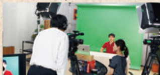
コンテンツの開発・制作支援

シラバスや講義資料などをもとに、資料の効果的な提示方法のご提案、教材のブラッシュアップ、講義の撮影・編集など、eラーニングコンテンツの制作支援を行います。