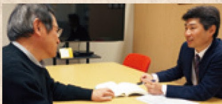
授業科目担当者へのICTを活用した教育支援

インストラクショナル・デザイン (ID / 教育設計) の手法を元に、ICTを活用した授業構成の見直し及び授業をより効果的・効率的・魅力的なものにするための授業設計の支援を行います。