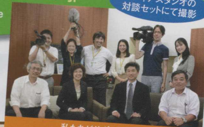
私たちがサポートします!