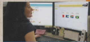
eラーニング運用サポート

シラバスや講義資料などをもとに、資料の効果的な提示方法のご提案、教材のブラッシュアップ、講義の撮影・編集など、eラーニングコンテンツの制作支援を行います。