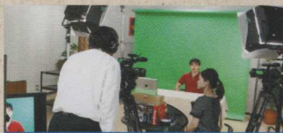
コンテンツの開発・制作支援

シラバスや講義資料などをもとに、資料の効果的な提示方法のご提案、教材のブラッシュアップ、講義の撮影・編集など、eラーニングコンテンツの制作支援を行います。