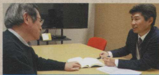
授業科目担当者へのICTを活用した教育支援

インストラクショナル・デザイン (ID / 教育設計) の手法をもとに、ICTを活用した授業構成の見直し及び授業をより効果的・効率的・魅力的なものにするための授業設計の支援を行います。