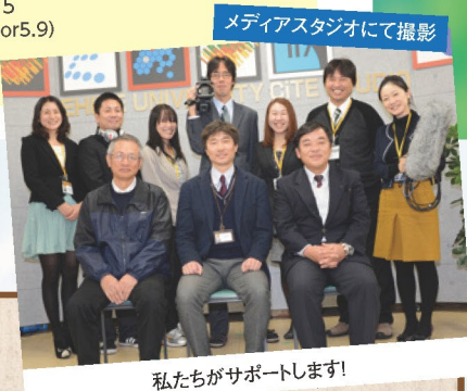
メディアスタジオにて撮影 私たちがサポートします!

「学習意欲を高めるためのID入門」など、授業設計に関する研修を行います。また、Word、Excel、PowerPointなどのICT研修会開催、教育事例の紹介など、利用者の教育実践を支援します。