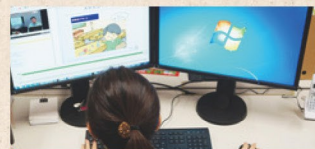
eラーニング運用サポート

シラバスや講義資料などをもとに、資料の効果的な提示方法のご提案、教材のブラッシュアップ、講義の撮影・編集など、eラーニングコンテンツの制作支援を行います。