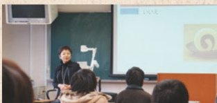
授業科目担当者へのICTを活用した教育支援

インストラクショナル・デザイン (ID / 教育設計) の手法をもとに、ICTを活用した授業構成の見直し及び授業をより効果的・効率的・魅力的なものにするための授業設計の支援を行います。