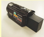
Sony HDR-CX560V (デジタルビデオカメラ)