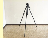
SONY VCT-80AV-TH (三脚)