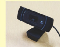
Logitech HD Pro Webcam C910 (PC 接続用カメラ)