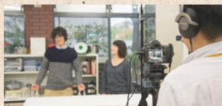
コンテンツの開発・制作支援

インストラクショナル・デザイン (ID / 教育設計) の手法をもとに、ICTを活用した授業構成の見直し及び授業をより効果的・効率的・魅力的なものにするための授業設計の支援を行います。