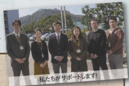
私たちがサポートします!

「eラーニング入門」「効果的なeラーニングの活用方法」など、eラーニングに関する研修を行います。また、Word、Excel、PowerPoint などの研修会開催、ICT 活用教育事例の紹介など、利用者の ICT 利用に関するスキルアップを支援します。