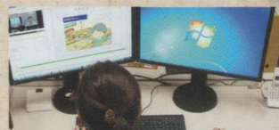
eラーニング運用サポート

シラバスや講義資料などをもとに、資料の効果的な提示方法のご提案、教材のブラッシュアップ、講義の撮影・編集など、eラーニングコンテンツの制作支援を行います。