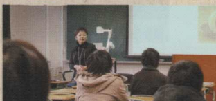
授業科目担当者へのICTを活用した教育支援

インストラクショナル・デザイン (ID / 教育設計) の手法をもとに、ICT を活用した授業構成の見直し及び授業をより効果的・効率的・魅力的なものにするための授業設計の支援を行います。