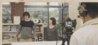
コンテンツの開発・制作支援

インストラクショナル・デザイン (ID / 教育設計) の手法をもとに、ICT を活用した授業構成の見直し及び授業をより効果的・効率的・魅力的なものにするための授業設計の支援を行います。