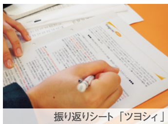
振り返りシート「ツヨシィ」

回数を重ねることで、学生たちも「どうすれば良い振り返りができるか」が分かり、回答の量や質も深まってきました。また、教員が学生の発信に対して真摯に応えることで、学生の授業に対する姿勢も積極的になってきました。