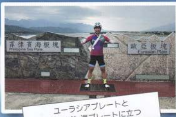
ユーラシアプレートとフィリピン海プレートに立つ

花東峡谷 ユーラシアプレートとフィリピン海プレートが押し合う場所、花東峡谷。プレート境界を見ることができ、世界でも花東峡谷とアイスランドの国立公園の2か所だけ。激レアなバワースポットだ！地球がもたらされる力を感じるこの場所でお約束のポーズ。 麗しの島 途中、サイクルトレインに乗った。座席の半分すらりと自転車と並ぶ。向かいの車窓に広がる風景を暫し堪能する。そういうには、台湾一周サイクリングのタイトルは「Formosa 9000」。Formosaとはポルトガル語で麗しの島。1544年に台湾を訪れたポルトガル人が、あまりの自然の美しさに「Iha Formosa 麗しき島」と賞賛したことに由来するらしい。皆さんぜひ、この麗しの島、台湾を体験してください。