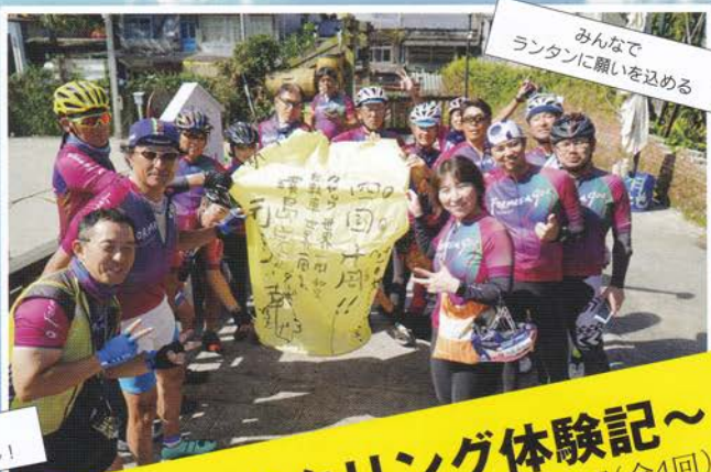
みんなでランタンに願いを込める