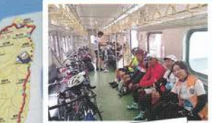
サイクルトレインで移動中の一枚