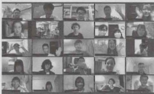
オンラインでの交流を行った、愛媛大と台湾の国立高雄科技大の学生ら

オンライン交流の初回となった今回は、新型コロナウイルス感染症対策における日本と台湾の異同についてもディスカッションを行い、「同じ感染症への対策でも、異なる部分がある」といった意見が交わされた。